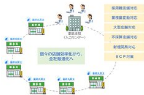
導入効果(メリット)